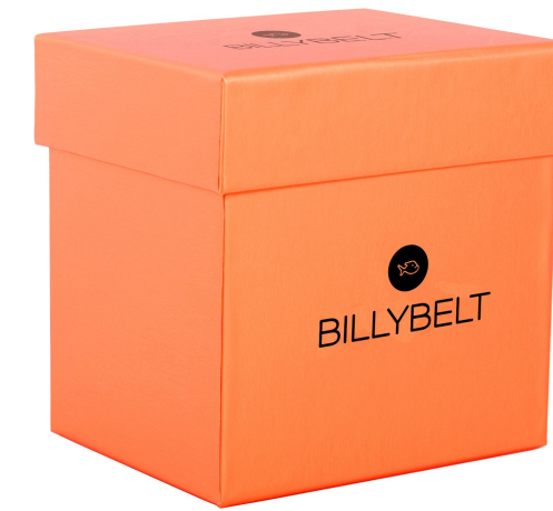
Coffret orange BXD011