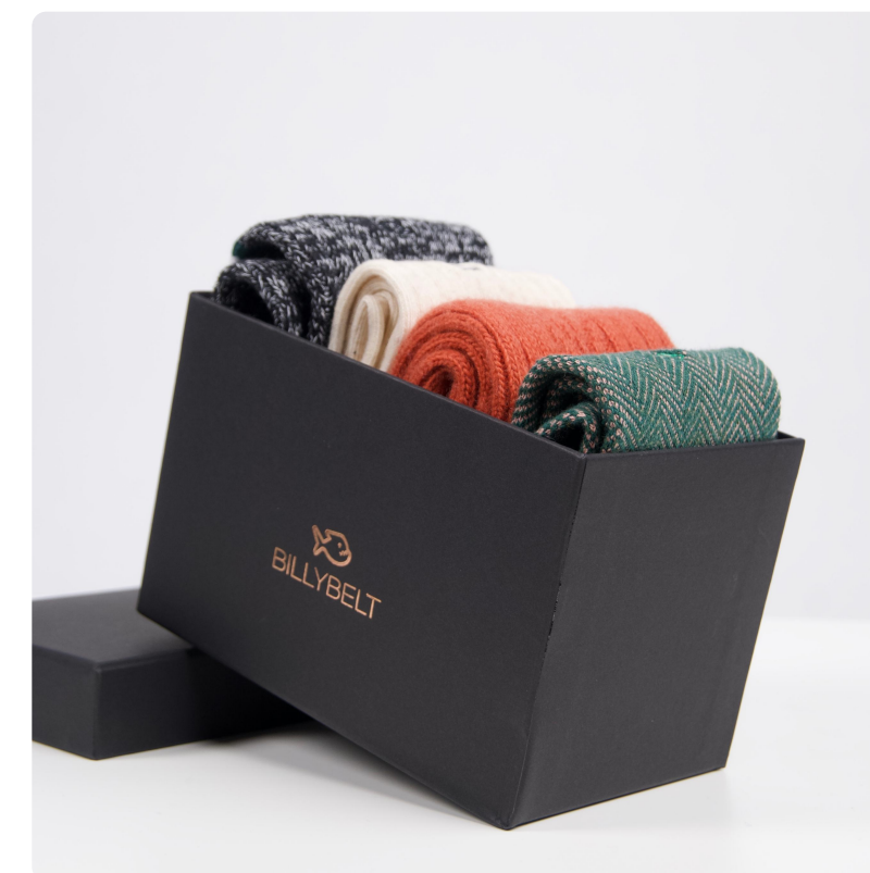
Coffret chaussettes - 3