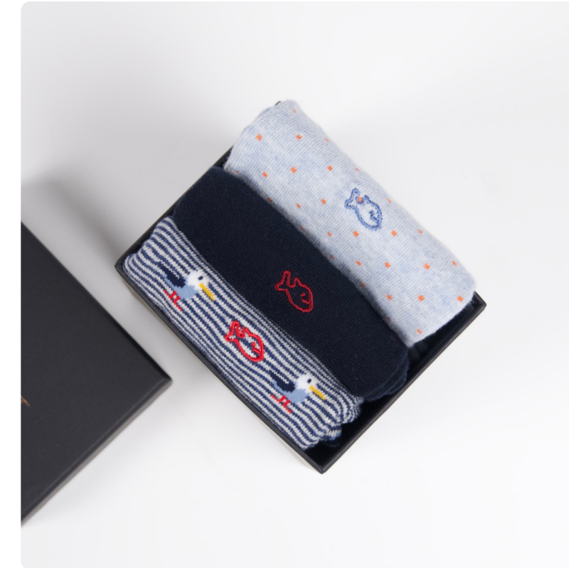
Coffret chaussettes - 1