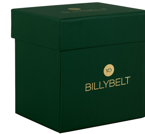
Coffret vert BXD012