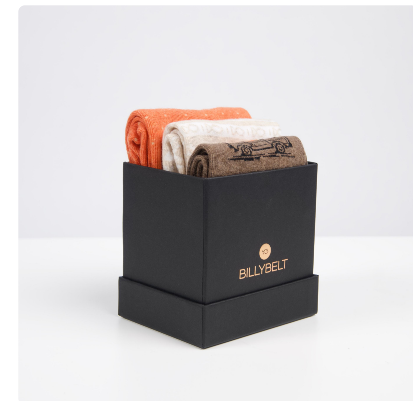
Coffret chaussettes - 4