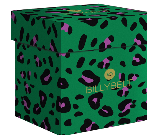
Coffret léopard vert BXD015