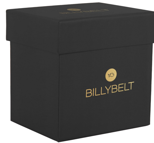
Coffret noir BXD001

Possibilité de changer la couleur des coffrets.