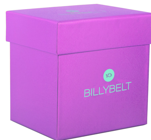
Coffret violet BXD013