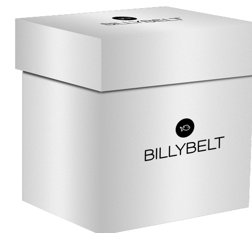
Coffret argent BXD014