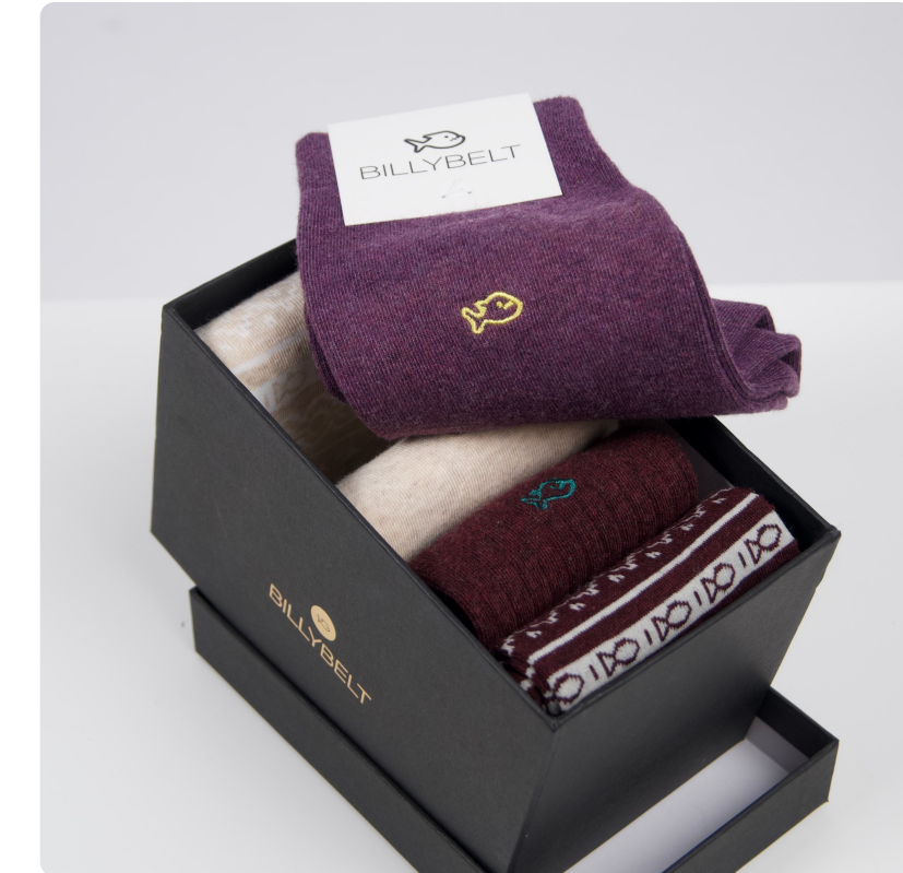
Coffret chaussettes - 2